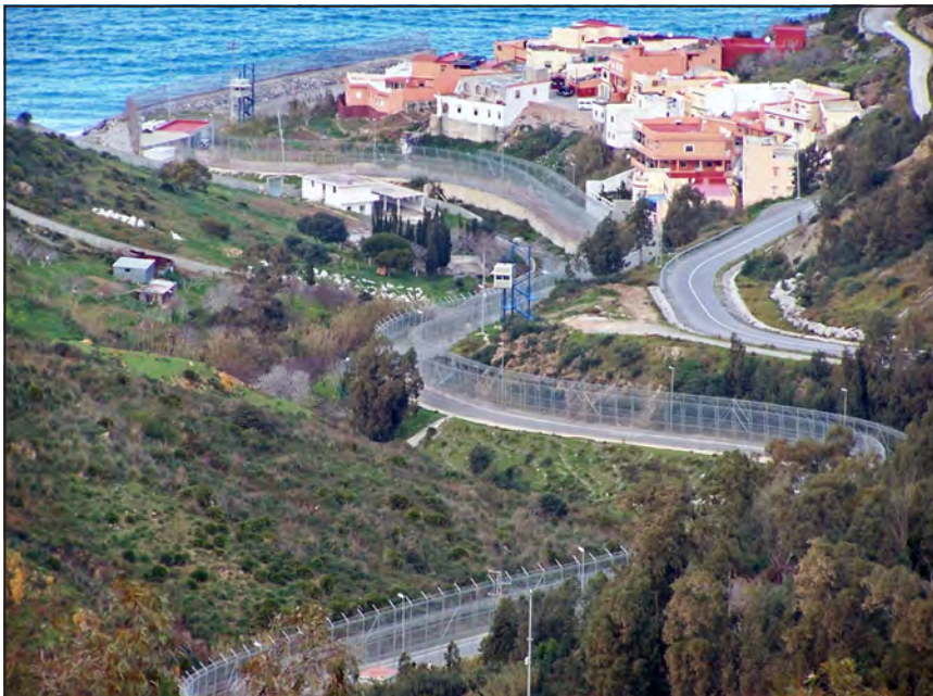
Figura 3. El perímetre Ceuta-Marroc

costes de la península Ibèrica (European Commission, 2005). En conseqüència, la pressió migratòria a les fronteres de Ceuta i Melilla va augmentar de manera remarcable. La tardor del 2005 es van multiplicar les entrades irregulars a través del perímetre. Centenars d'immigrants van poder creuar la frontera a través de les tanques, però molts més no ho van aconseguir. El 29 de setembre de 2005 van morir 5 immigrants que provaven de creuar irregularment la frontera de Ceuta (Van Houtum i Ferrer-Gallardo, 2010). Els successos de la tardor de 2005 van precedir el reforçament de la tanca i la intensificació dels controls fronterers, tant per part espanyola com per part marroquina (Blanchard i Wender, 2007; Ferrer-Gallardo, 2007). A partir d'aleshores, el nombre d'entrades irregulars es va reduir. Tanmateix, se'n van seguir produint: 339 l'any 2009, 561 el 2010 i 1.402 el 2012. 9 El cas de Sambo Sadiako, un senegalès de 30 anys, il·lustra la persistència d'episodis tràgics a l'entorn del perímetre de Ceuta. En Sambo va provar de creuar la frontera el 7 de març de 2009 però no ho va aconseguir. El seu cos es va quedar atrapat a la tanca metàl·lica. Es va fer una ferida al braç amb el material tallant de la tanca i es va dessagnar fins a la mort. 10