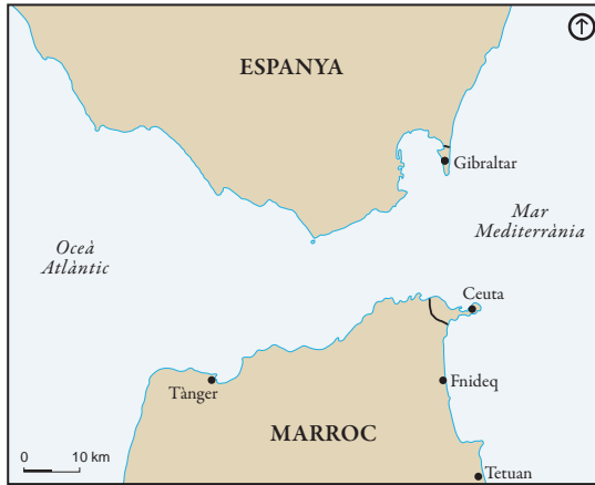
Figura 1. Estret de Gibraltar

perfil de la regió fronterera varia depenent de com es conceptualitzi i demarqui el hinterland (o “rerepaís”) de Ceuta. Si bé l'àrea d'influència de Ceuta podria circumscriure's a la ciutat marroquina de Fnideq (46 km 2 ), el ressò de la frontera abasta, com a mínim, el conjunt de la regió de Tànger-Tetuan (11.570 km 2 ). En qualsevol cas, en aquest treball, Fnideq és conceptualitzat com l'epicentre del vessant marroquí de la regió fronterera.